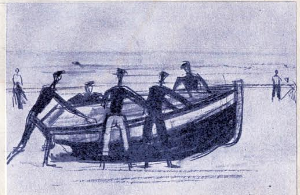
Barque de sauvetage (Le Touquet)