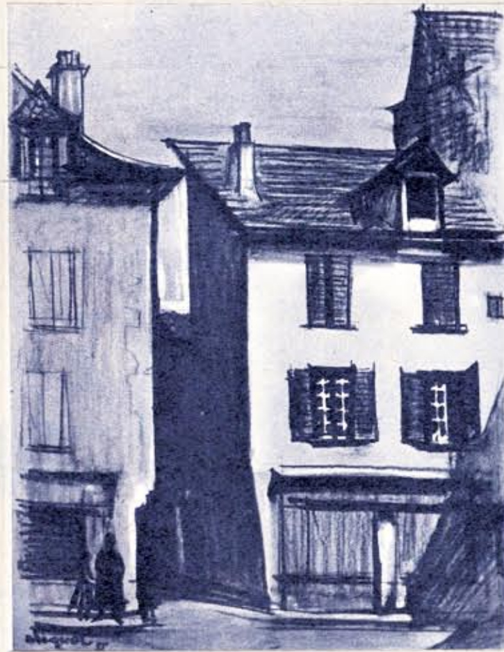
Vieilles maisons (St-Geniez d'Oit - Aveyron)