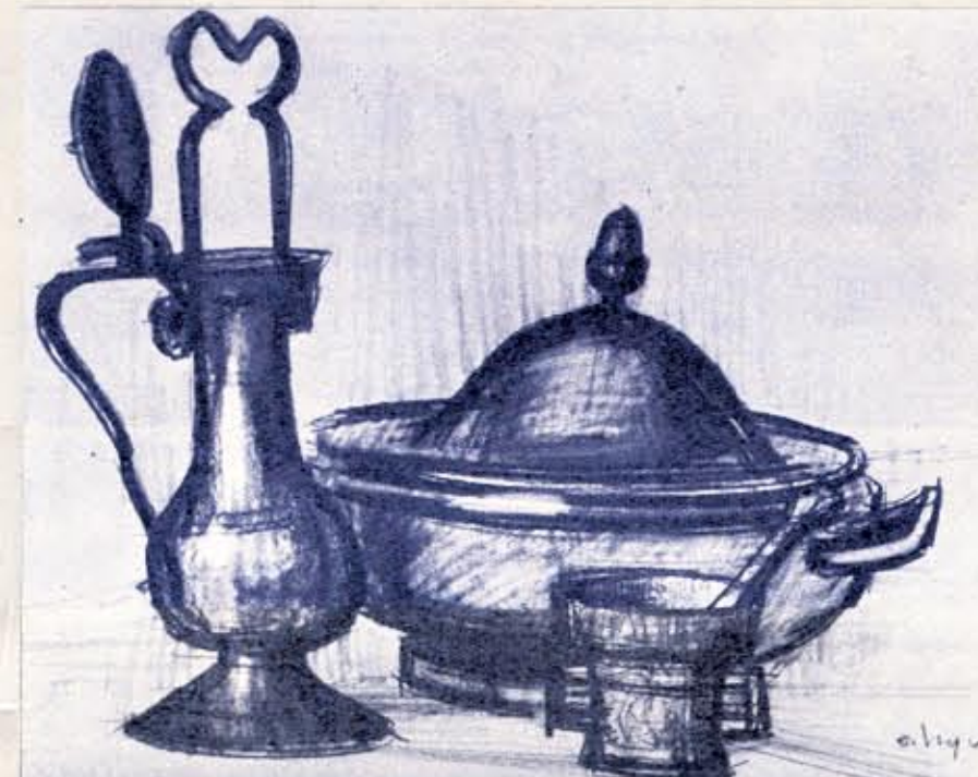
Nature morte aux étains